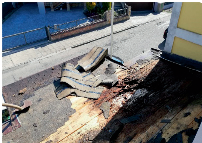
Stav střechy po odkrytí